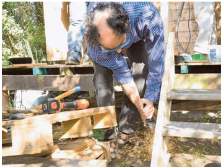
Die freiwilligen Mitarbeiter von Siemens und Combit werden am Malteser Social Day von mehreren Fachmännern unterstützt.

Entstanden ist aus dieser Idee der Malteser Social Day. Auch die Konstanzer Malteser haben bei diesem Tag des Engagements mitgemacht, sechs Projekte wurden am vergangenen Freitag umgesetzt. So bekam der Spielplatz hinter dem Feuerwehrgerätehaus in Wollmatingen ein Klettergerüst, ein Gartenhaus der Wurzelkinder vom Waldkindergarten wurde renoviert, das Treppenhaus der Sänfterschule neu gestrichen und das Tierschutzheim bekam eine Besucher-ecke. Daneben brachten die freiwilligen Helfer ein Sonnensegel im Quartierszentrum