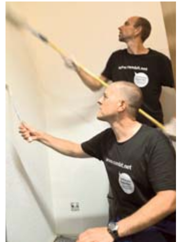
Der Käthe-Luther Kindergarten erhält einen neuen Anstrich.