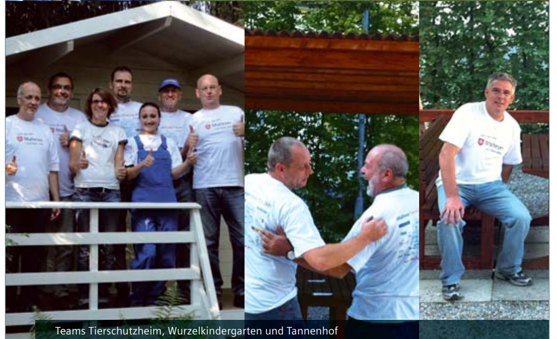
Teams Tierschutzheim, Wurzelkindergarten und Tannenhof