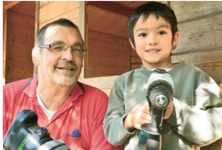
Die jungen angehenden Nutzer der Holzhütte sind mit ihren Handwerkern zufrieden. In Zukunft soll die Hütte als Lesehaus genutzt werden.