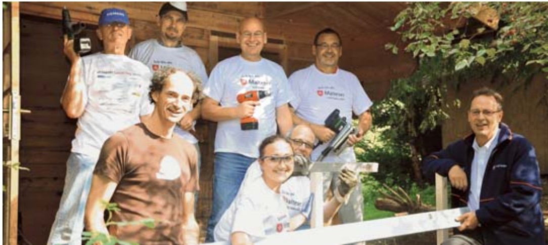
Sechs Mitarbeiter von Siemens renovieren eine Holzhütte des Waldkindergartens. Die Hütte bekam der Kindergarten geschenkt, für die Renovierung waren die Freiwilligen am Freitag zuständig.